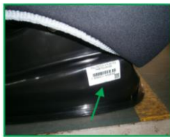
Código de barras deve ser colado na base da poltrona