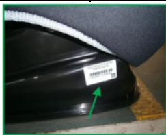
Código de barras deve ser colado na base da poltrona